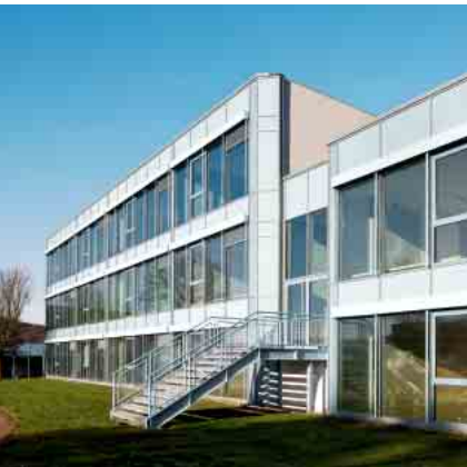
Schüco Aluminium Tür-System ADS 75.SI Schüco Aluminium door system ADS 75.SI