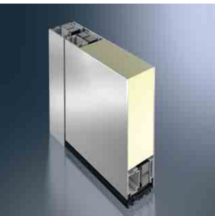
Schüco Tür-System ADS 75.SI Schüco door system ADS 75.SI

Die hochwärmedämmte Tür für hohe Ansprüche an das Energiemanagement in Kombination mit funktionellen Ansprüchen.